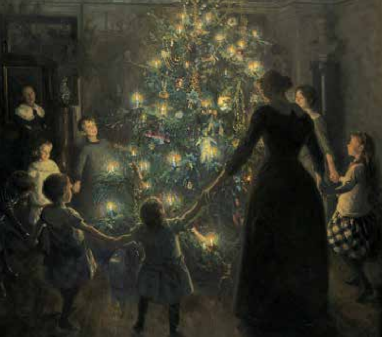
VIGGO JOHANSEN, GLADE JUL, 1891. DEN HIRSCHSPRUNGSKE SAMLING