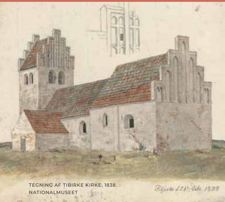
TEGNING AF TIBIRKE KIRKE, 1838. NATIONALMUSEET